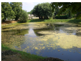
Antes del tratamiento

El agua es un elemento importante en el diseño de los campos de golf. Lagos y riachuelos limpios y claros con alta calidad de agua son requeridos. Conceptos del cultivo convencional sin embargo llevan a la creación de algas y pozos de agua pestilente. Las causas son habitualmente altas dosis de nutrientes en los fertilizantes, recortes de césped, uso de productos químicos contra algas (algicidas), manipulación impropia con las algas, inadecuado estado de los peces y plantas.... El concepto biológico SANBOS® Waterclear revitaliza y mejora elementos del agua de manera ecológica, sostenible y rentable.