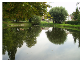
Después del tratamiento