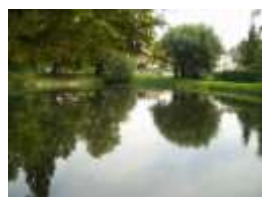
Después del tratamiento