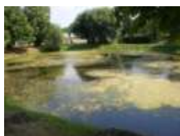
Antes del tratamiento

El agua es un elemento importante en el diseño de los campos de golf. Lagos y riachuelos limpios y claros con alta calidad de agua son requeridos. Conceptos del cultivo convencional sin embargo llevan a la creación de algas y pozos de agua pestilente. Las causas son habitualmente altas dosis de nutrientes en los fertilizantes, recortes de césped, uso de productos químicos contra algas (algicidas), manipulación impropia con las algas, inadecuado estado de los peces y plantas.... El concepto biológico SANBOS® Waterclear revitaliza y mejora elementos del agua de manera ecológica, sostenible y rentable.